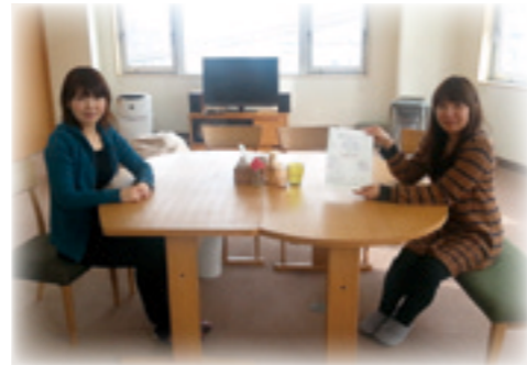
左が須貝センター長

〒051-0011 室蘭市中央町 2-7-13 室蘭中央町米塚ビル 4F TEL : (0143) 22-3300 FAX : (0143) 22-3366