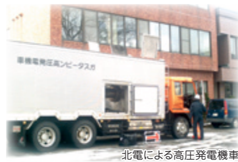
北電による高圧発電機車

今回の経験で千寿会の災害対策の弱点も浮き彫りとなりましたので、災害に強い千寿会となり患者様に対して、安心というサービスを提供できるように更なる努力が必要と感じております。