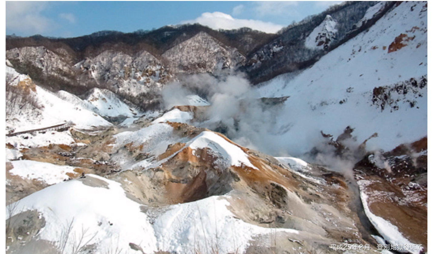
平成25年2月 登別地獄谷にて