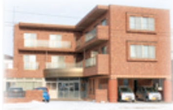
ステーション外観

訪問看護ステーションは、平成12年に開設され12年が経過しました。現在、看護師4名体制で利用者の必要に応じて週に2回から、月に1回の訪問看護を行っています。できるだけ地域生活を長く、自分らしく過ごしたいという思いを尊重し、思いやりのある対応を心がけながら、おもに健康上の管理や服薬管理、生活する上での相談や助言を行い、利用者の病状や障害の状況に合わせて、日常生活動作の維持・回復を図り利用者の生活の質の向上に向けた支援を行っています。入院生活から地域へ生活を移行された方や独居で生活に不安のある方などの相談を随時、受け付けていますので、いつでもお問い合わせください。