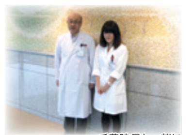
千葉院長と一緒に

実習生をお受けし、共に「考える」ことで、当法人スタッフも医療と福祉の原点に立ち返るきっかけとなっております。